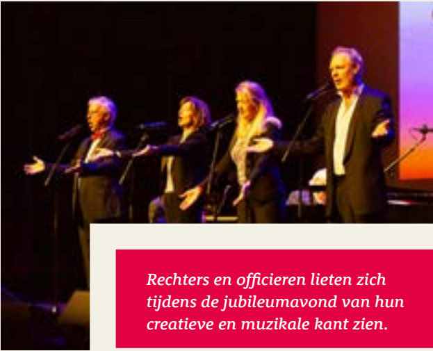
Rechters en officieren lieten zich tijdens de jubileumavond van hun creatieve en muzikale kant zien.