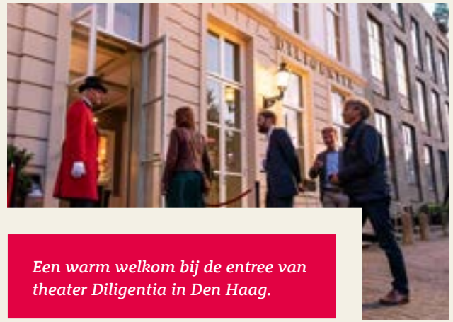
Een warm welkom bij de entree van theater Diligentia in Den Haag.