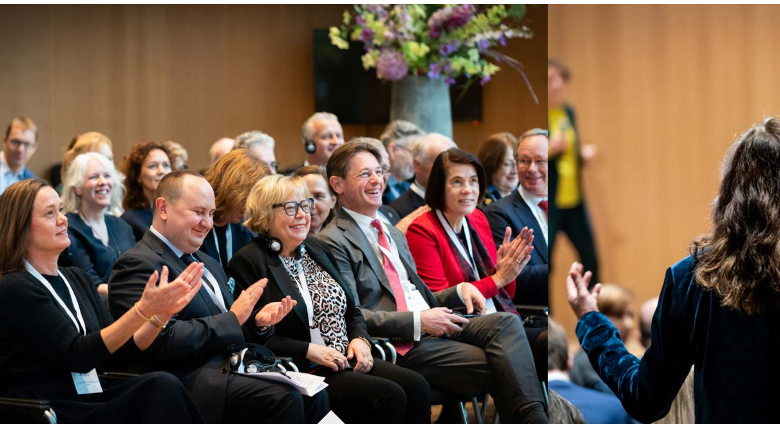
Malgorzata Gersdorf (midden) was speciale gast tijdens de Rechtsstaatconferentie.

Malgorzata Gersdorf, president van het Hooggerechtshof in Polen. Gersdorf kwam eerder in het nieuws, nadat de Poolse regering had aangekondigd alle rechters boven de 65 jaar met vervroegd pensioen te sturen. Daardoor zou er ruimte komen om nieuwe, meer regeringsgezinde rechters aan te stellen. Gersdorf verzette zich met succes en onder druk van de Europese Commissie werd de maatregel teruggedraaid. Andere maatregelen laten echter zien dat de Poolse regering geenszins van plan is zich door Europa te laten weerhouden vergaande hervormingen in het rechterlijk domein door te voeren. Gersdorf verwees in haar speech onder andere naar de benoemingsprocedure van rechters in het Constitutioneel Hof. Dat gerecht oordeelt of wetten die de Poolse regering uitvaardigt wel voldoen aan de in de Grondwet neergelegde normen. Rechters van het Constitutioneel Hof worden inmiddels benoemd door de regering zelf. “Een staat waarin de grenzen tussen wettigheid en wetteloosheid worden verduisterd, is geen rechtsstaat. Mensen die niet in overeenstemming met de Grondwet worden benoemd, beslissen over de grondwettelijkheid van de wetten in het Constitutioneel