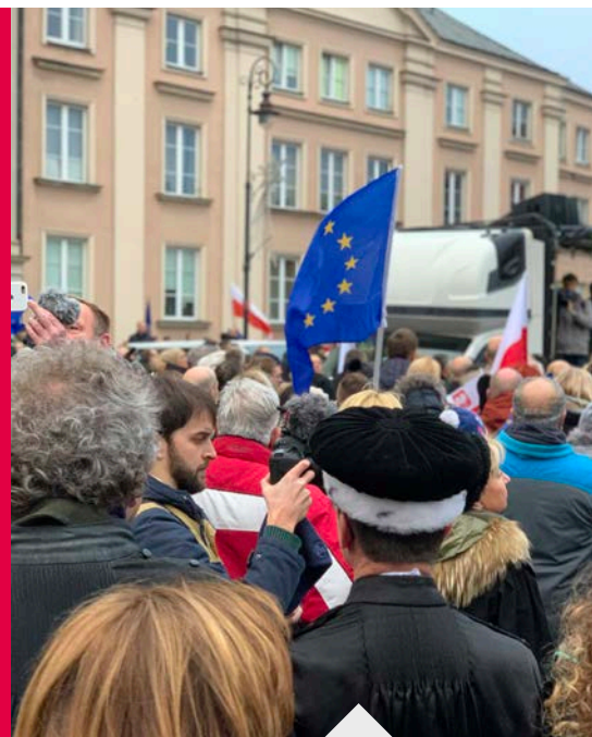
Nederlandse rechters protesteren mee in Polen.

De Poolse rechters en de rechtstaat staan onder druk. Zowel burgers als de rechterlijke macht komen hiertegen massaal in beweging. Op 11 januari gingen duizend toga's de straat op in Warschau tijdens een stille tocht, georganiseerd door onze Poolse zustervereniging Iustitia. Een delegatie van de NVvR liep mee.