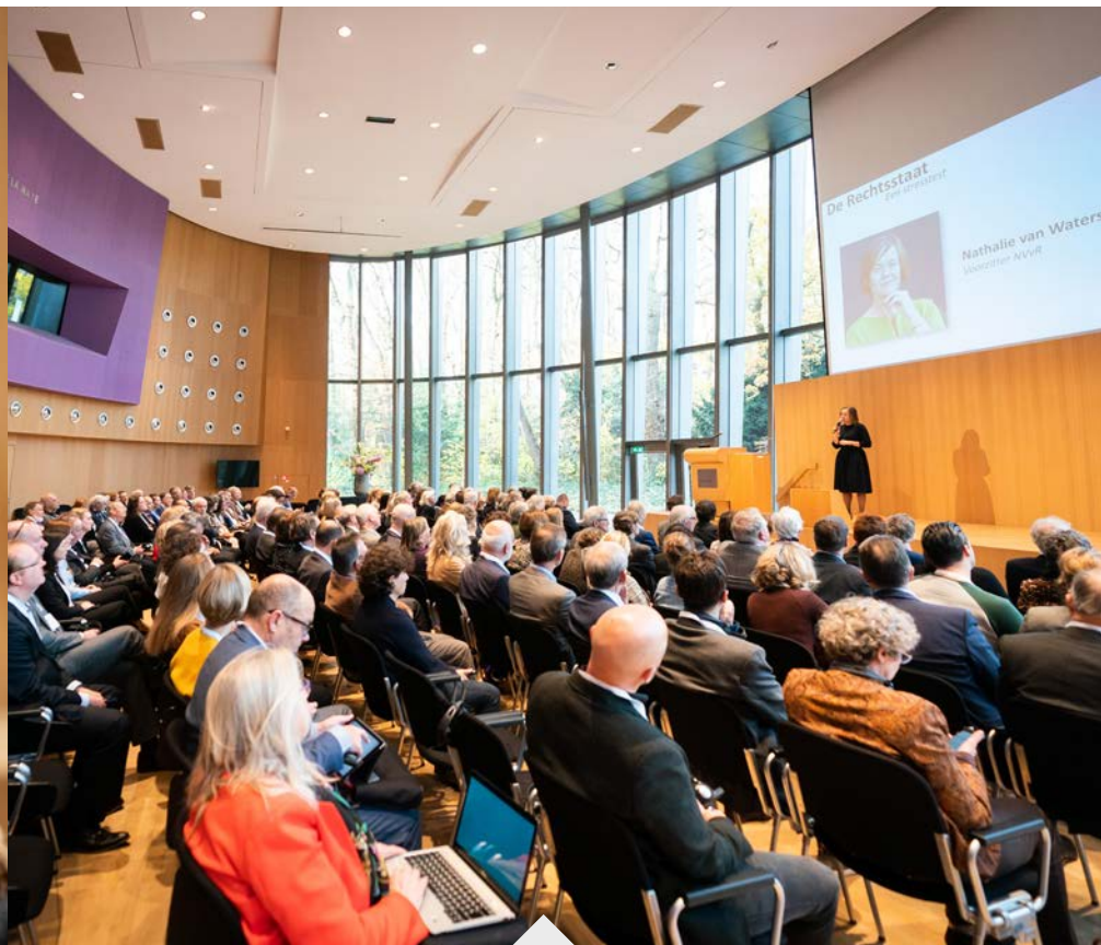
NVvR-leden, politici, journalisten en belanghebbenden bijeen in het Vredespaleis.