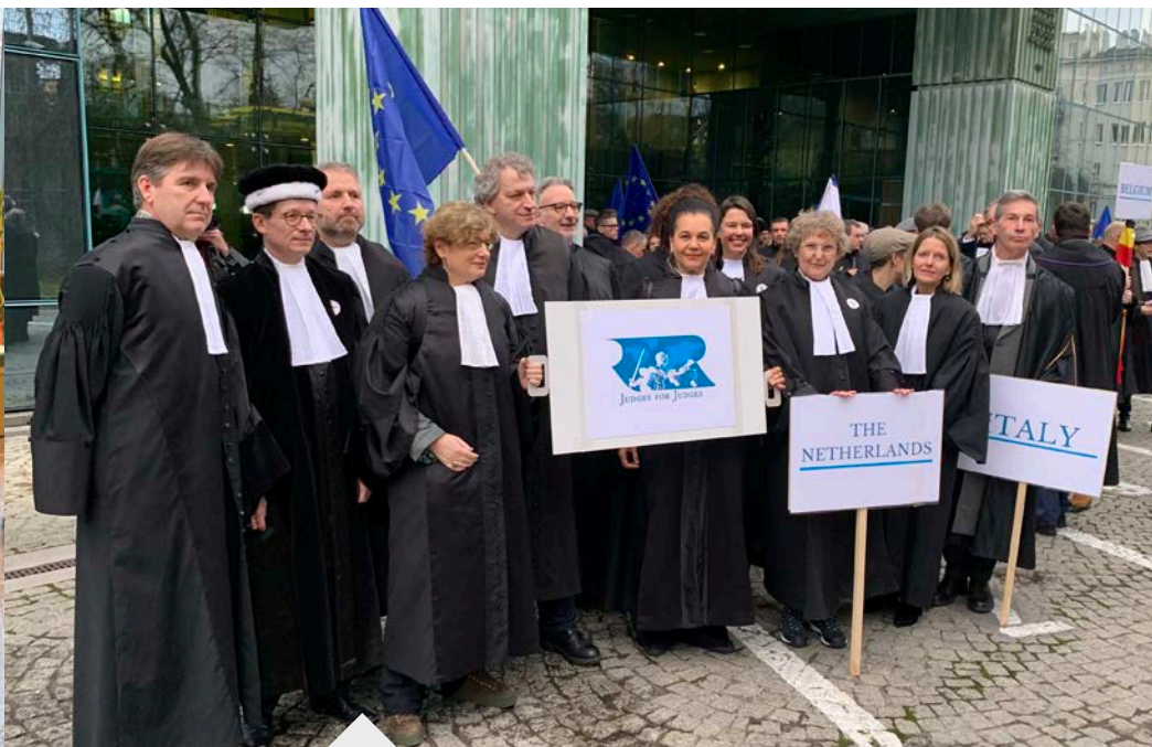
Toga's in de straten van Warschau.

Alle delegaties werden in Warschau ontvangen door de president van het Poolse Hooggerechtshof, mevrouw Malgorzata Gersdorf. In november 2019 was zij op uitnodiging van de NVvR in Nederland. Tijdens de rechtsstaatconferentie in Den Haag benadrukte zij hoe fragiel de trias op dit momenteel balanceert en waarschuwde zij voor een steeds grotere politieke inmenging in het rechtsbestel. Voorafgaand aan de tocht in Warschau bevestigden verschillende rechters uit andere Europese landen, waaronder Hongarije en Bulgarije, dat ook in hun landen de rechtspraak onder druk staat. "U wordt aangevallen van voren, wij van achteren," zei een Hongaarse rechter tegen zijn Poolse collega's. Daarmee doelde hij op maatregelen die in Hongarije binnen de rechtspraak zelf worden genomen om de onafhankelijkheid van rechters te beteugelen. Ook dan gaat het bijvoorbeeld om het overplaatsen van rechters, het korten op salarissen of het publiekelijk veroordelen van rechterlijke vonnissen.