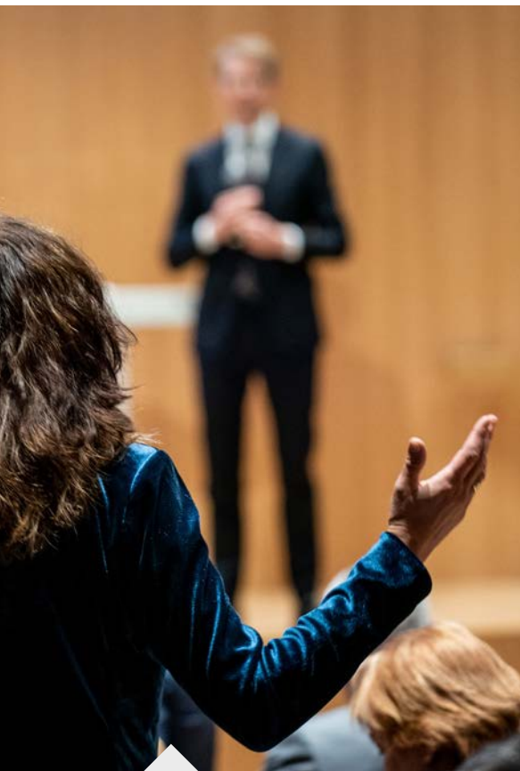
De zaal in gesprek met minister Sander Dekker.