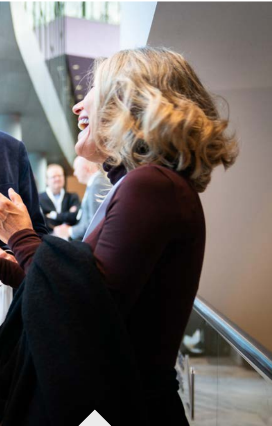
Er was ook tijd om bij te praten en te netwerken.